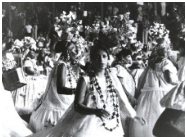
Imagem 2 – Desfile da Em cima da hora em 1972.