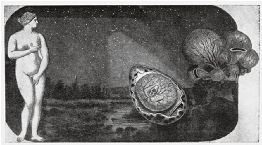
Figura 8 - Primeira fotomontagem que abre o livro A Pintura em Pânico (1942) de Jorge de Lima

Então ele nasceu de um trombone e o trombone o alimentou por treze meses, depois ele foi desmamado e colocado na areia, sozinho com o camelo, então ele nasceu de uma mulher e ficou muito surpreso, e refletiu sobre seu peito, ele chupava, cuspiu, não sabia mais o quê. – Henri Michaux