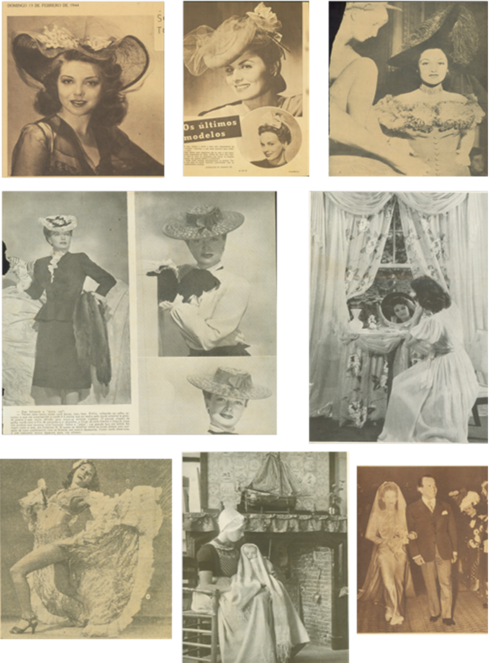
Figura 4 - Recortes Encontrados no Acervo de Jorge Lima na AMLB - Figuras Femininas