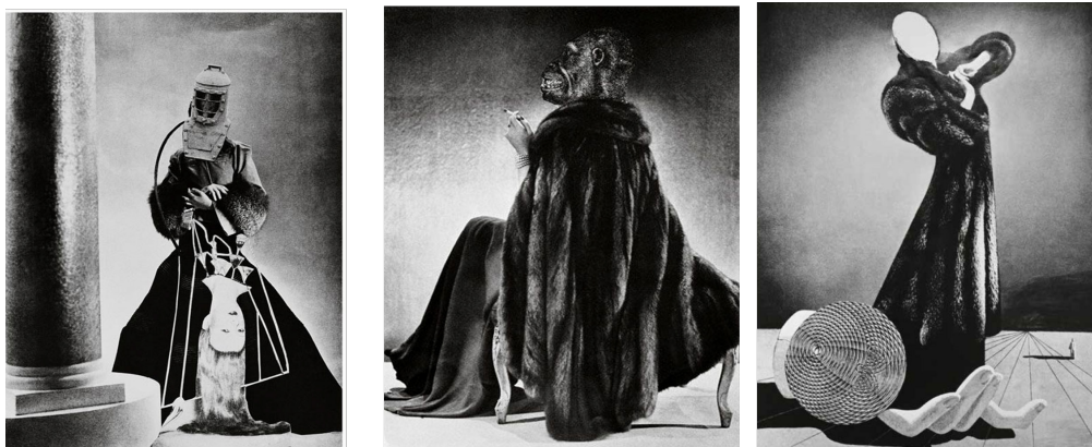
Figura 1, 2 e 3 – Fotomontagens de "A Pintura em Pânico" (1942) de Jorge de Lima

e 3, abaixo). Nestas obras o rosto e a cabeça das mulheres são a parte do corpo privilegiada para as mutações, sendo substituída por outros objetos e seres insólitos.