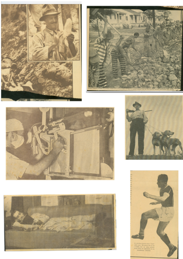
Figura 5 - Recortes Encontrados no Acervo de Jorge Lima na AMLB - Figuras Masculinas

Já os recortes com as figuras masculinas foram, em sua maioria, colocados no campo nomeado como “Trabalho”. Nelas os homens estão na sua maioria de corpo inteiro, com enquadramento em plano aberto, e estão a realizar alguma ação ou ofício: estão a jogar futebol, a praticar esportes, a caçar, a cavalgar, a garimpar, a trabalhar na construção civil (ou em trabalhos forçados, no que parece ser uma cena em um presídio), a ler, a estudar e a atender pacientes. Muitas das vezes estão concentrados em afazeres intelectuais e artísticos de maneira solitária, leem em suas poltronas ou pintam em seus gabinetes/ateliês (fig.5, conjunto de recortes, abaixo).