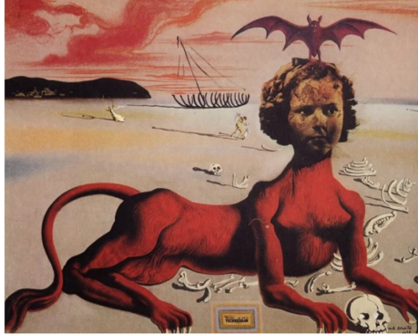
Figura 11 - Salvador Dalí - “Shirley Temple. The Youngest, Most Sacred Monster of the Cinema in Her Time”. Guache, Pastel e Colagem em papel Cartão, 1939. Acervo Museum Boijmans Van Beuningen, Rotterdam.

A esfinge também aparece nos quadros de Salvador Dalí, em uma obra especialmente cômica, datada de 1939, em que o pintor retrata a esfinge com a cabeça de uma celebridade infantil de Hollywood: Shirley Temple (fig. 11, acima). Novamente, os motivos da decapitação, do híbrido entre animal e humano, aliados à figura feminina, ressurgem fulgurosamente. É como se nesta imagem se resumisse, em uma “casca de noz”, a aventura surrealista.