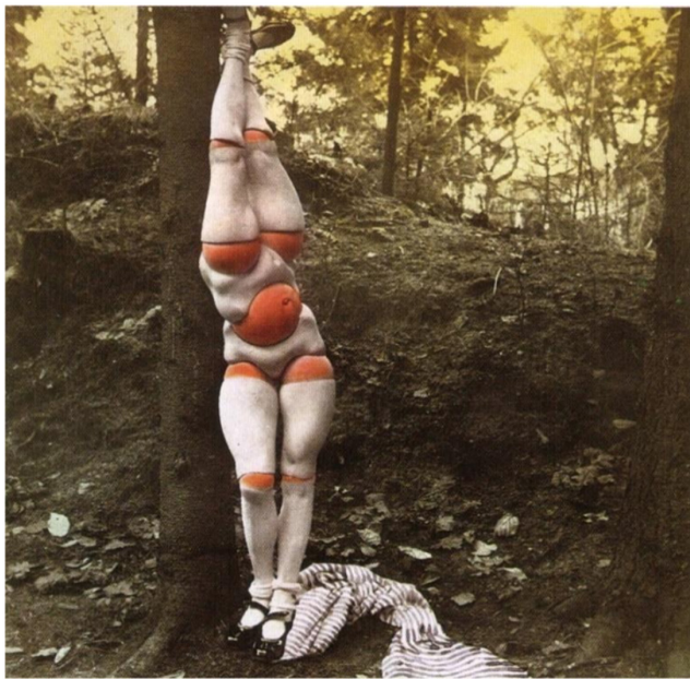
Figura 7 - Hans Bellmer, Les Jeux de la Poupe , Fotografia, 1935-1936