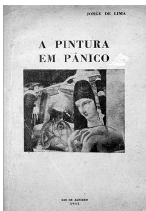
Figura 12 - Reprodução da capa da 1ª edição da Pintura em Pânico de Jorge de Lima

De todo modo, não excluindo outras interpretações, e sem a pretensão de encerrar o debate neste artigo, nos parece que Lima buscou, à sua maneira, mesmo que timidamente, reabilitar as potências selvagens da desmedida dionísica, através das forças disruptivas do feminino, questionando, ainda que sub-repticiamente, a lógica burguesa e as posições patriarcais dominantes que reservavam à mulher uma posição de mero objeto “para-ser-olhado”, advogando em prol da liberdade coletiva e criativa do espírito humano.